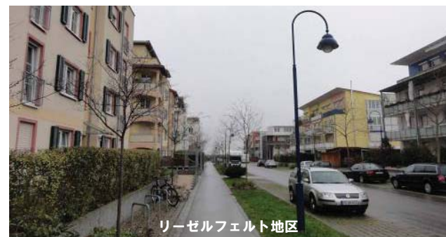
リーゼルフェルト地区

当地区は、行政主導によってつくられた環境まちづくり地区である。72haの土地に11,000人が居住しており、人口密度は東京都とほぼ同じである。ヴォーバン地区との違いは、車の乗り入れを可能にした(せざるを得なかった)ことである。車のスペースを確保する代わりに、集合住宅の高さを平均5、6階にしている(ヴォーバン地区の集合住宅は、平均4階)。