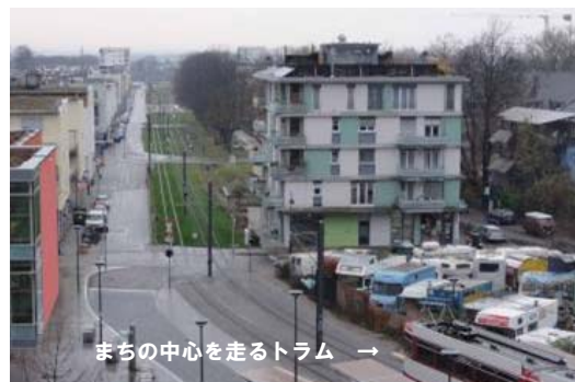
まちの中心を走るトラム

当地区の特徴的な政策として、車両の通行規制がある。車が住宅地内を通り抜けすることができない構造となっており、地区の外側に共同駐車場を設置している。地区の中央にはトラムが走っており、家からは駐車場(2箇所)よりトラムの停留所(3箇所)へ行く方が近くなるように設計されている。これは、環境への配慮というより、地区の人口密度を高めるために、車を置くスペース、車を走らすスペースを削減して、一定の土地内に住居を密集させて生活をさせるためである。住居を密集させるといっても、日本の都市のイメージとは全く異なり、これで人口密度が高いのかと首を傾げたいような土地の広い使い方だ。