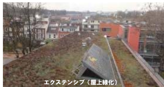
エクステンシブ(屋上緑化)