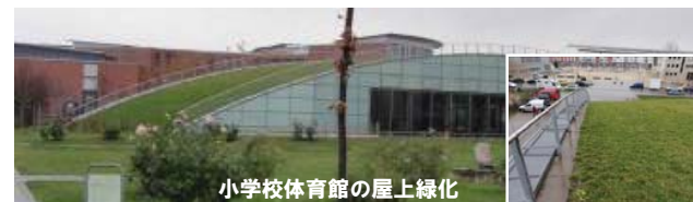
小学校体育館の屋上緑化

碁盤の目のように道路が張り巡らされており、ある意味違和感がない。車の問題以外は、新規開発地区同様に、地域熱暖房やゴミ処理等、環境に配慮したまちづくりがなされている。