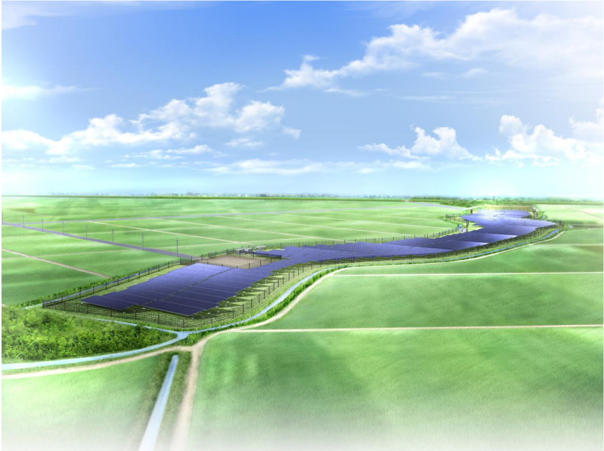
行田ソーラーウェイ完成イメージ図

【日本アジアグループ株式会社について】 http://www.japanasiagroup.jp/