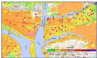
浸水予測地図の表示例（赤いピンは避難ビル）