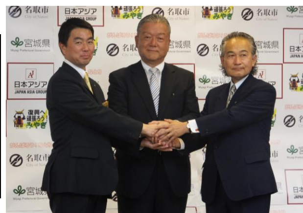
2014年7月28日 事業実施協定締結式の様子(宮城県庁にて)