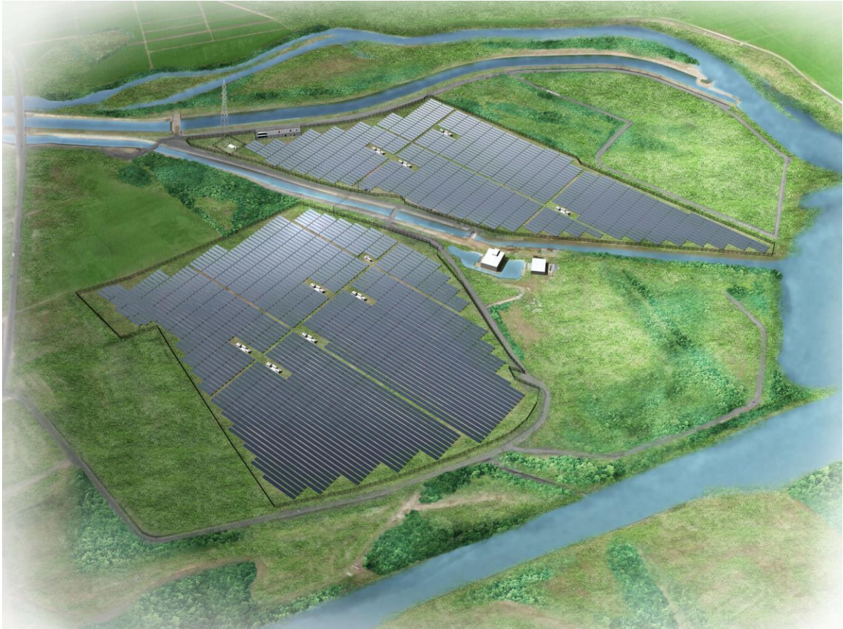
「(仮称)名取ソーラーウェイ」完成イメージ図

【日本アジアグループ株式会社について】 http://www.japanasiagroup.jp/