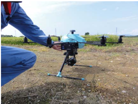
業務に用いるドローン