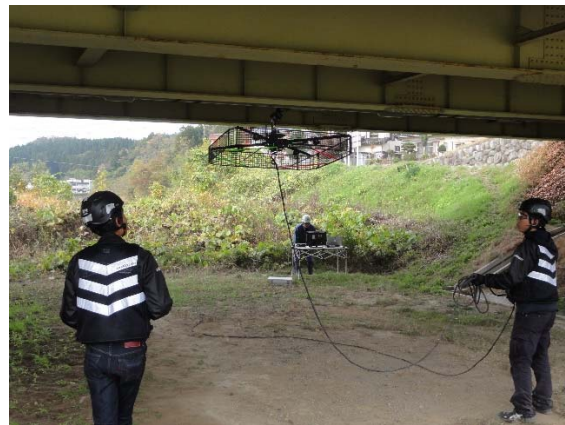
橋梁点検での使用例(イメージ)